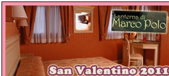
San Valentino Lanterna di Marco Polo